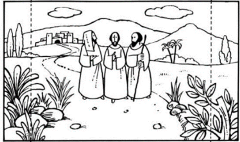
Twee vrienden Twee vrienden van Jezus lopen van Jeruzalem naar Emmaüs. Terwijl ze druk met elkaar in gesprek waren, kwam Jezus bij hen lopen. Maar zij wisten niet dat Hij het was, want zij dachten dat Jezus gestorven was. Later in huis merkten zij dat Jezus was opgestaan!